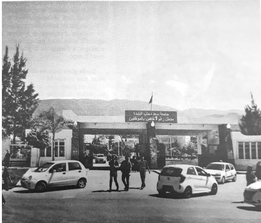
Université Saad Dahleb, Blida

son 2024/2025, où l'université aura régulièrement son espace à travers une émission hebdomadaire en direct du campus ainsi que des couvertures relatives aux activités officielles, pédagogiques et scientifiques». La même directrice a ajouté lors d'un point de presse organisé en marge de la signature de la convention que cette dernière «permettra surtout aux chercheurs de faire ressortir leurs thèses des tiroirs, tout en leur assurant, à travers des émissions et couvertures, un travail de promotion qui serait bénéfique et pour l'économie nationale et pour la société d'une manière générale».