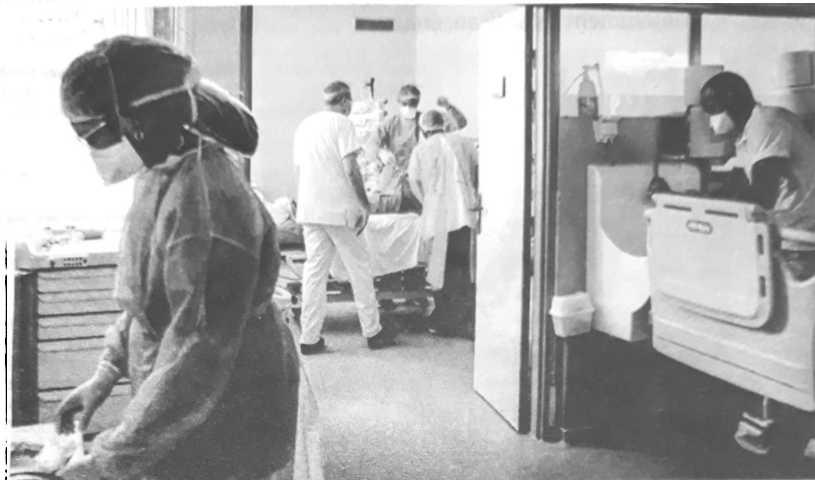
Les médecins réclament une réforme profonde du secteur de la santé en Algérie