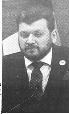
ياسين مهدي وليد

أما بخصوص تمويل الشركات الناشئة، أوضح الوزير أنه تم إطلاق صندوق تمويل بمعايير اقتصادية بحتة، لأن أكبر تحد هو توجيه رؤوس الأموال للابتكار، مشيرا في ذات الصد إلى إنشاء عدد من الأليات في قوانين المالية، كقانون المالية 2021 الذي تمت فيه المصادقة على مادة للتمويل التشاركي وكذا قانون المالية 2022 الذي تم فيه إدراج سندات التوظيف الخاصة بهدف تشجيع القطاع الخاص في الاستثمار في الصناديق الاستثمارية وقانون المالية 2023 الذي تم فيه إدراج تحفيزات ضريبية مع إنشاء فرع للشركات الناشئة على مستوى البورصة. بالمقابل انتقد الوزير ياسين مهدي وليد استحداث كل من الوكالة الوطنية لدعم المقاولاتية "أناد" والوكالة الوطنية لتسيير القرض المصغر "أنجام" كجهازي دعم.