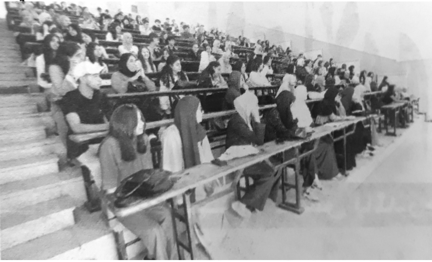
من: حمزة كالي

التحق أمس، أكثر من 1.8 طالب جامعي بالمدرجات، في موسم جديد يتميز بإجراءات بيداغوجية وتنظيمية نوعية، تترجم الأهمية التي توليها السلطات العليا في البلاد لهذا القطاع، على رأسها استحداث المدرسة العليا للأمن السيبراني، واعتماد 32 عرضا تكوينيا جديدا، مع فتح خمسة عروض تكوين، وتعزيز اللغة الصينية بجامعة الجزائر 2، ناهيك عن إدراج 15 شهادة مزدوجة، أي بكالوريا واحدة لشهادتين جامعتين.