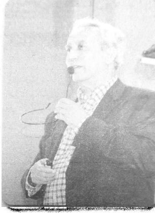
الخطوات التي قطعها وصولا لما وصل له اليوم، بأن الطلبة اليوم لا يفكرون كما كان الطلبة يفكرون في

مجال الصناعة، فالباحث على علم بأن المادة المنتجة كيف تصل للمستهلك على عكس الأستاذ الجامعي الذي لا يعلم كيف يتم التصنيع، موضحا بأنه فلا يمكن أن يتم وضع كل العبء على الأستاذ الجامعي في مجال إنشاء المؤسسات الناشئة، فالدور الذي الذي يجب أن يلعبه الأستاذ هو تشریح كيفية الإنشاء وكل الخطوات المرتبطة بذلك مع تقديم المجال بعدها أمام الصناعيين لاستثمار ذلك، وهنا يأتي -بحسب المتحدث- دور أصحاب المؤسسات الناشئة الذين يتلقون المعلومات الميدانية على الأستاذة ويطورونها بعد ذلك وصولا لمجال التصنيع، ولا يمكن بأي حال من الأحوال أن يوصل الأستاذ الفكرة إلى مادة مصنعة، مؤكدا بأن الذي يوصل الفكرة للمستهلك هو المهم، ولكي يتم النجاح في العمل يجب أن يكون فريق بدائية بصاحب الفكرة وصناعي يوصل الفكرة ومستثمرة يمول الفكرة لتجسيدها وهي أمور أساسية لإنجاح المؤسسات الناشئة.