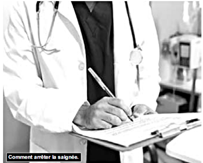
Comment arrêter la saignée.

De même, le Syndicat national des médecins (SNM) affilié à l'Ugta a exprimé, à la fin de l'année précédente, sa préoccupation au ministre de l'Enseignement supérieur suite à sa décision de gel prise quelques mois plus tôt pour arrêter la ruée des médecins