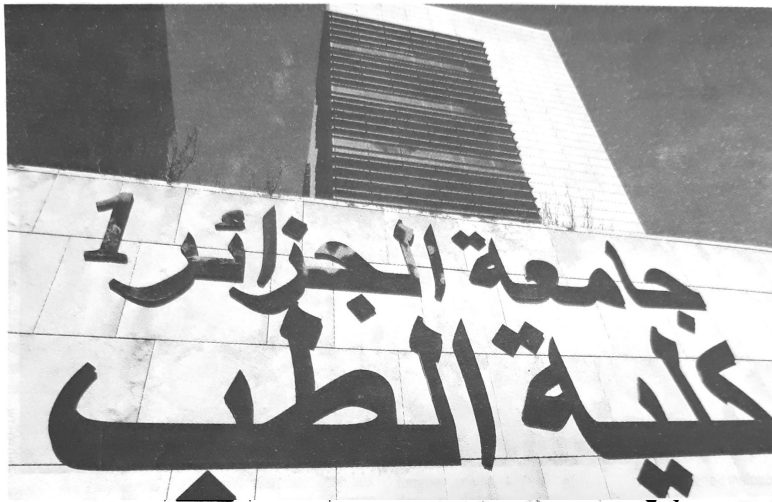
Les étudiants en médecine ont engagé un bras de fer avec leur tutelle

Le ministre de l'Enseignement supérieur avait rencontré, dimanche, les représentants des étudiants grévistes. Un procès-verbal (PV) sanctionnant la